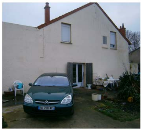
DP7 - Visuel de près - Avant