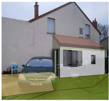
DP5 - Visuel de près - Après