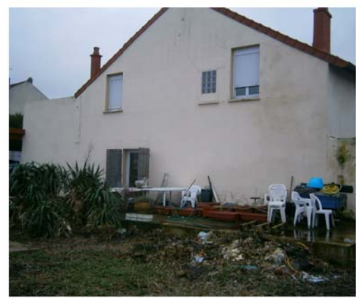
DP8 - Visuel de loin - Avant