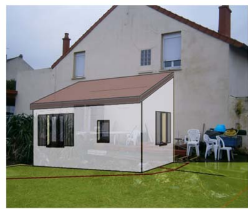
DP6 - Visuel de loin - Après